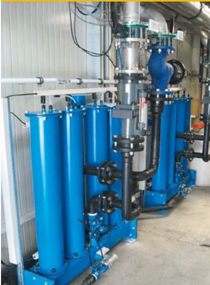
Bild 3: Installation zur Behandlung eines offenen Kühlwasserkreislaufes

Ein weiterer Vorteil gegenüber herkömmlichen Ionenaustauschern besteht darin, dass Chemikalien nicht erforderlich sind, um das neue Aufbereitungssystem zu regenerieren.