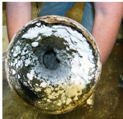
Bild 1: Deutlich sichtbare Kalkablagerungen in der Aufbereitungsanlage

Herkömmliche Verfahren der Kühlwasseraufbereitung arbeiten nach wie vor mit Chemikalien. Der folgende Beitrag zeigt, wie das Wasser in offenen und geschlossenen Kühlwasserkreisläufen ohne zusätzliche Mittel kostengünstig und gezielt aufbereitet werden kann.