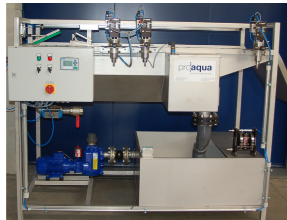
Flotationsanlage proaqua SF4

Partikel, die durch geringe Dichte zum Aufschwimmen neigen, können durch die Flotation aus dem Wasser ausgetragen werden. Zur Unterstützung dieses Prozesses werden Luftblasen erzeugt, die an den Partikeln anhaften.